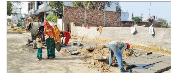
गन्नौर। बड़ी रोड पर नाले के स्लैब का निर्माण करते मजदूर।