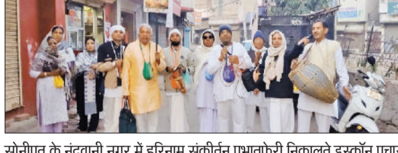
सोनीपत के नंदवानी नगर में हरिनाम संकीर्तन प्रभातफेरी निकालते इस्कॉन प्रचार समिति के सदस्य।