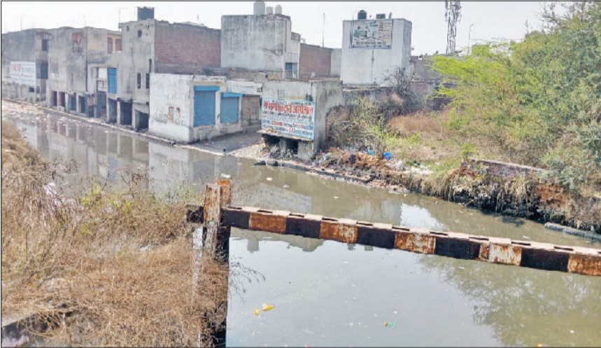
सोनीपत। सारंग रोड स्थित रेलवे अंडरपास के पास दुकानों के बाहर तक फैला दूषित पानी व कचरा।

सीवरेज लाइन में लीकेज इसी दौरान जनस्वास्थ्य विभाग की ओर से सीवरेज व्यवस्था के लिए लाइन बिछवाई गई थी। समय बीतने के साथ सीवरेज लाइन अब कई जगह से गलने के कारण लीकेज हो रही है। इसी कारण अंडरपास में समय-समय पर दूषित जलभराव की समस्या बनी रहती है। करीब एक सप्ताह से अंडरपास में भरा दूषित पानी अब ओवरफ्लो होकर आसपास बनी दुकानों तक पहुंच चुका है। अंडरपास के दोनों ओर कई दिन से लगा कूड़े का ढेर अब सड़क पर फैल चुका है। इससे दुकानदारों के कामधंधे की चौपट हो रहे हैं।