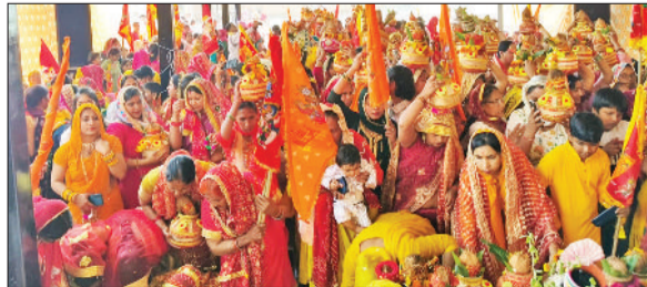
सोनीपत के शांति विहार में निकाली गई कलश यात्रा में शामिल महिलाएं।

प्राप्त करने वाले 90 साल से ऊपर बुजुर्गों, बैरागी समाज के उच्च अधिकारियों, देहेज रहित शादी करने वालों, गौर रक्षक, ब्याड कैप चलाने वालों और समाज में सामाजिक कार्य करने वालों पूर्व फौजी अधिकारियों को सम्मानित किया गया। इस अवसर पर गणमान्य लोग उपस्थित रहे।