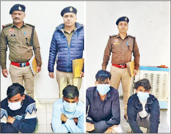
सोनीपत। पुलिस टीम के साथ गिरफ्तार आरोपित।