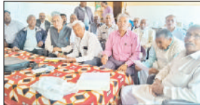
खरखौदा। बैठक में भागीदारी करते संस्थान के पदाधिकारी।