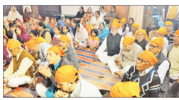
सोनीपत। कार्यक्रम के दौरान उपस्थित श्रद्धालुगण।