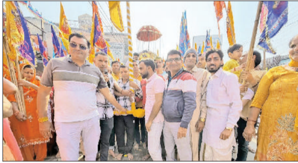
खरखौदा। श्री श्याम बाबा का पैदल रथ खींचते श्रद्धालु।