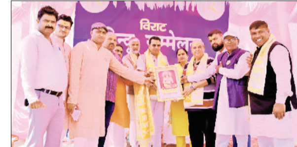
सोनीपत। कार्यक्रम में पहुंचे अतिथियों का स्वागत करते हुए।