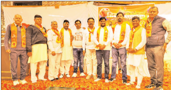
सोनीपत। लाल दरवाजा स्थित रविदास मंदिर में आयोजित हिंदू सम्मेलन के दौरान मौजूद आयोजक।